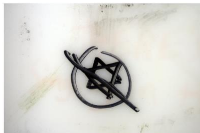
Antisemittismen er et begrep som er vanlig i Europa, ifølge forskningsrapport.

Av Hilde M. Johannessen Bager – 05.05.2024