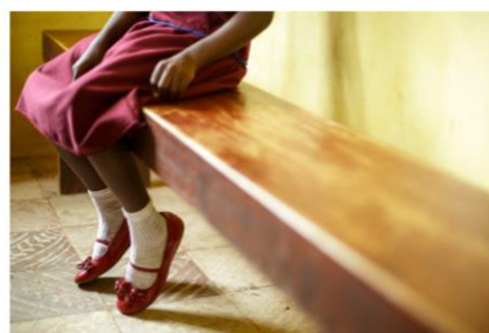
På verdensbasis er rundt 200 millioner kvinner og kvinner utsatte for kjønnslemlestelse. I Norge er det utvirket bekymring for at dette kan skje med norske ungdommer fordi familien tror det er en religiøs plikt. (Foto: Illustrasjon).

Av Hilde M. Johannessen Bager – 04.05.2023