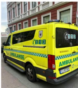
Hil og hjelp til å finne ut hva som er årsaken til sykdom og hvordan å behandle den. Ambulans på 113 er den beste kontaktpunktet med helse.

Av Hilde M. Johannessen Bager – 14.02.2023